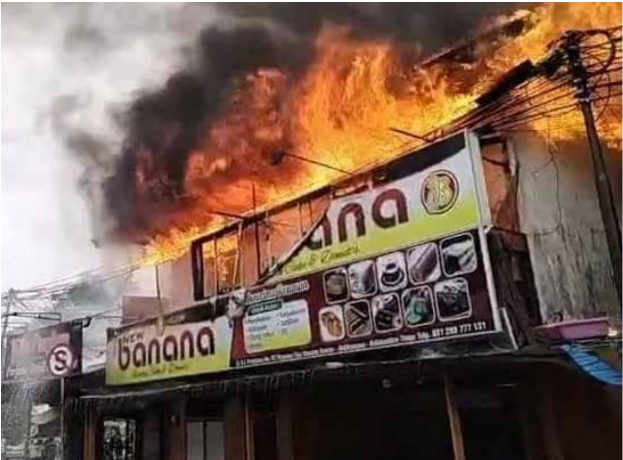
Kebakaran di toko kue Banana Gunung Guntur, Balikpapan Tengah, pada Kamis (9/11) sekitar pukul 14.10 Wita.