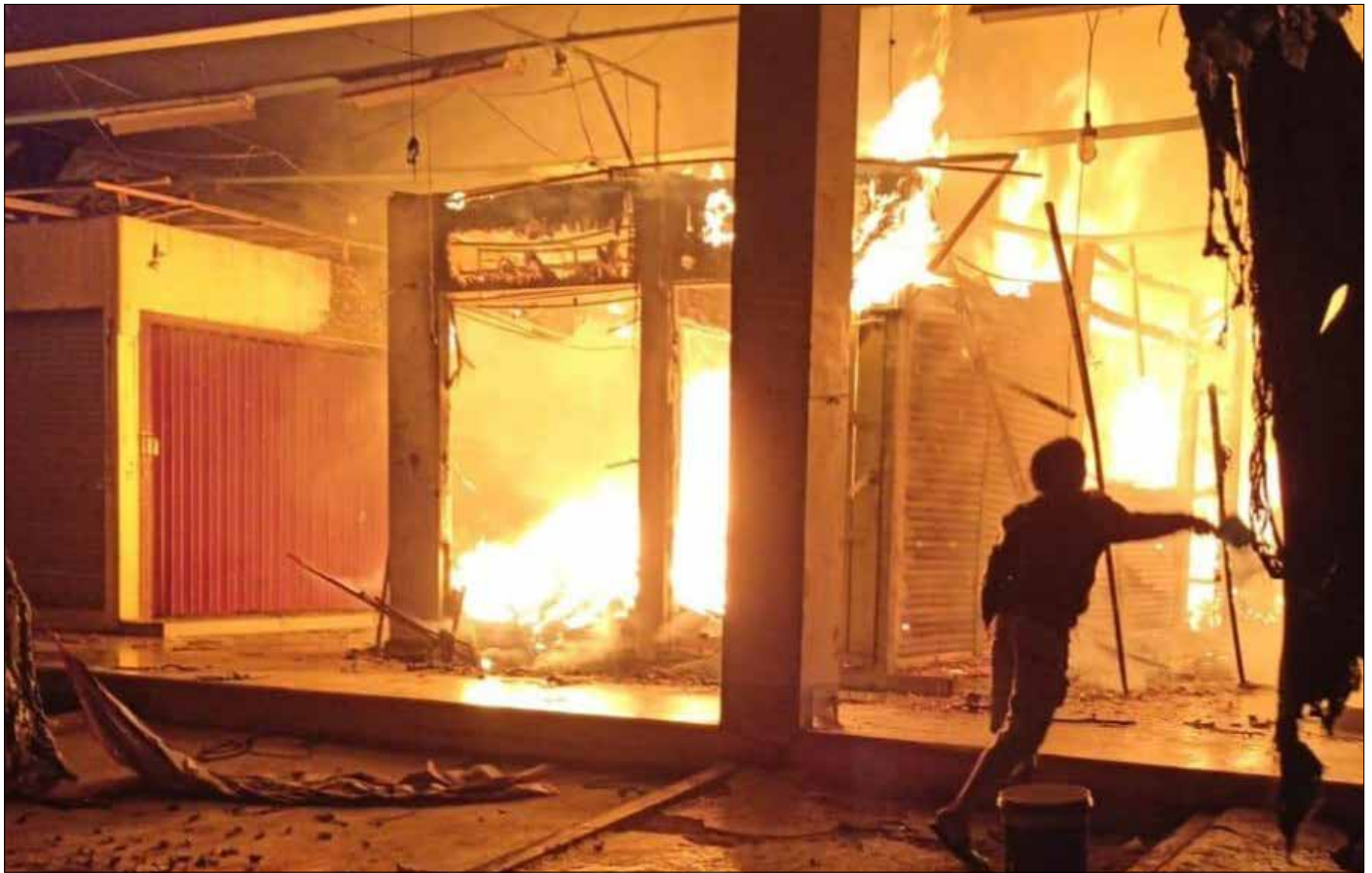
Kebakaran di Kios Pakaian Pasar Induk Penyembolum Senaken