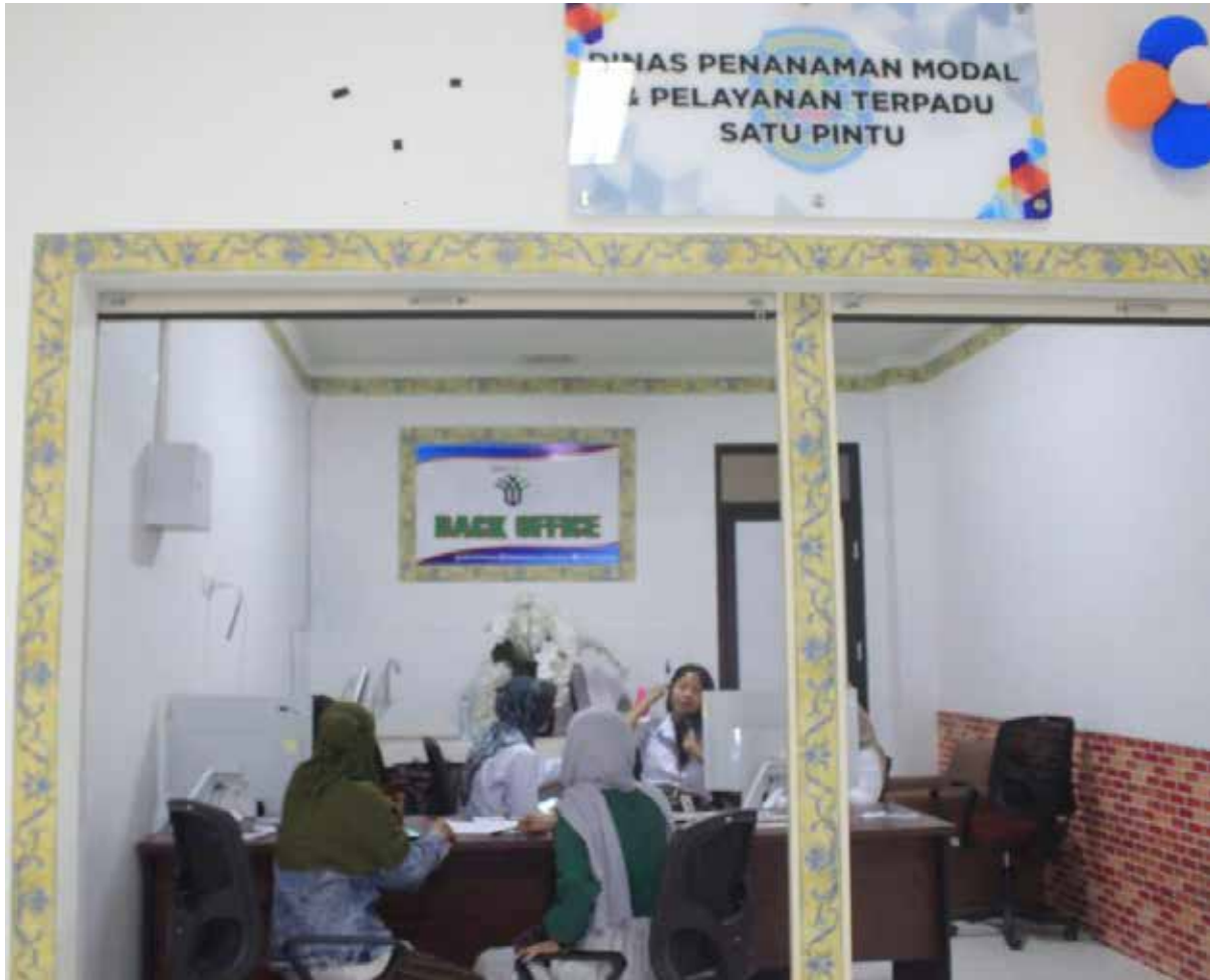
Outlet pelayanan DPMPTSP di Gedung MPP. (ist)