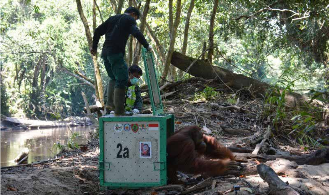
Petugas membuka pintu kandang dan melepaskan orangutan ke alam bebas di Hutan Kehje Sewen, Jumat 11 November 2023.