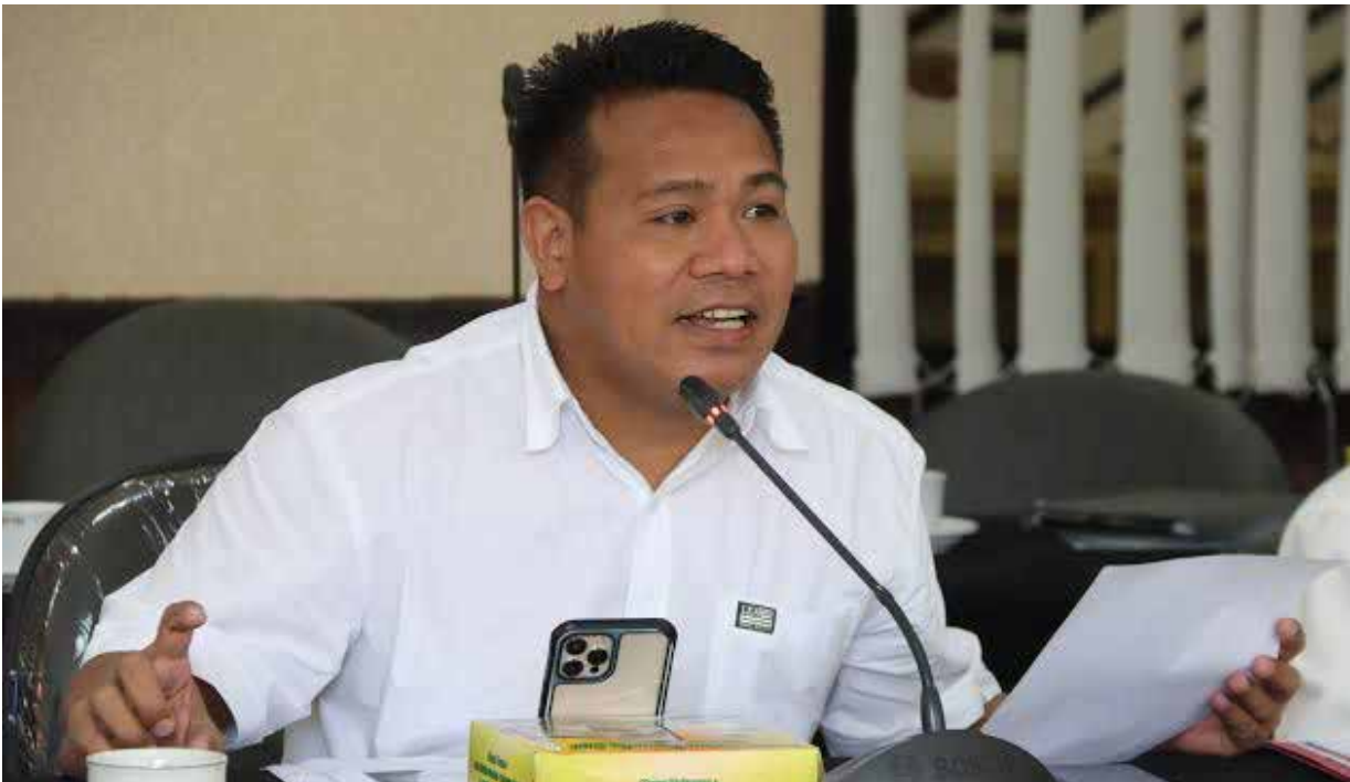
Wakil Ketua Komisi III DPRD Kaltim Syafruddin