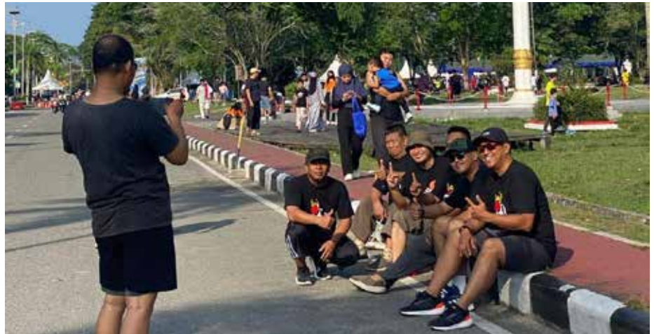
Kegiatan masyarakat di Lapangan Merdeka saat hari Minggu (12/11).

“Kami melihat penataan sementara yang dilakukan di sekitar Lapangan Merdeka menunjukkan perubahan yang signifikan. Lapangan 2 dan 3 saat ini digunakan sebagai lokasi berolahraga dan