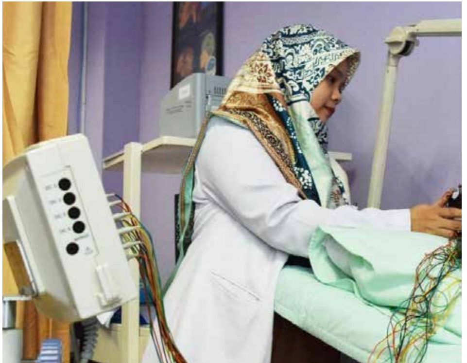
Dokter spesialis saraf atau neurologi saat memeriksakan pasien. (Yahya Yabo)

Selain itu, dr Atika menjelaskan, gejala stroke dapat terlihat berupa ganggu-