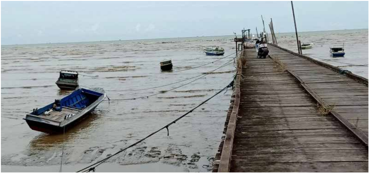
Perahu nelayan Kabupaten PPU sedang ditambat.