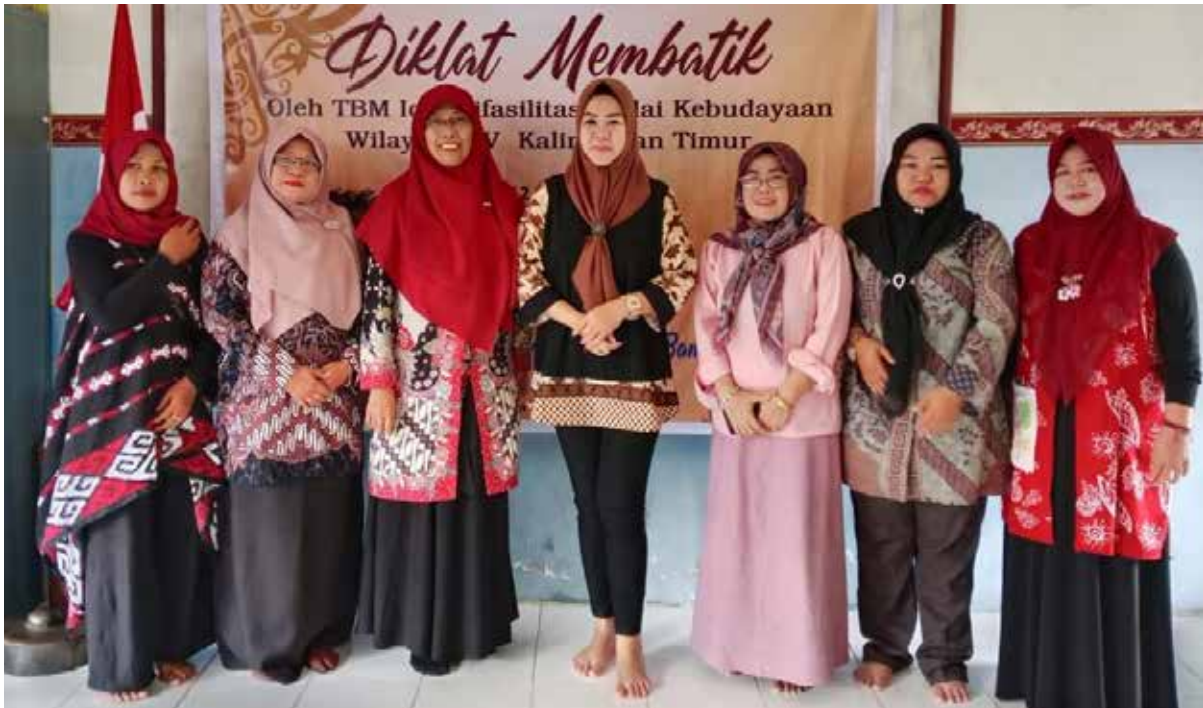
Acara Diklat Membatik