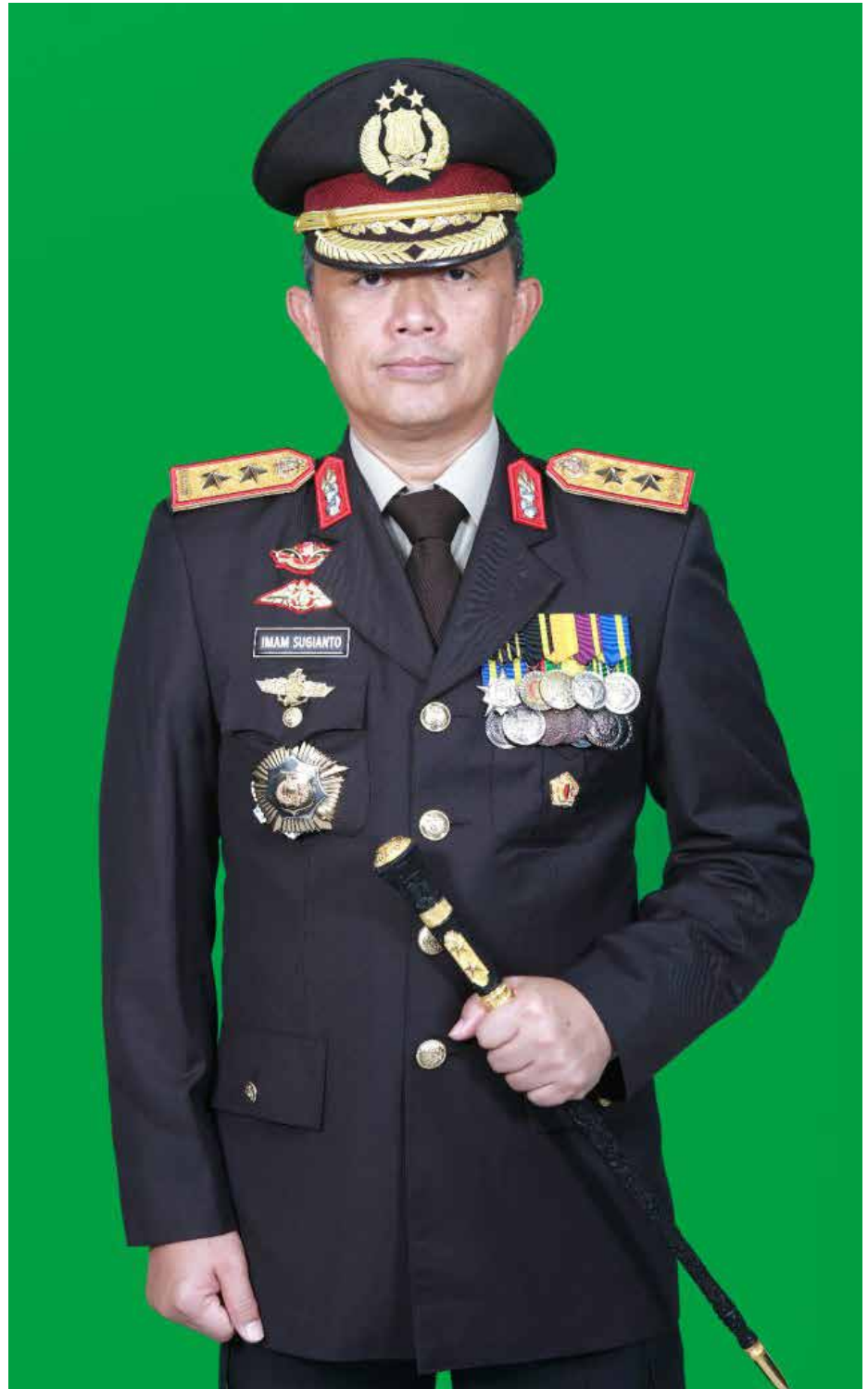
Kapolda Kaltim, Irjen Imam Sugianto yang akan mutasi menjadi Kapolda Jawa Timur.