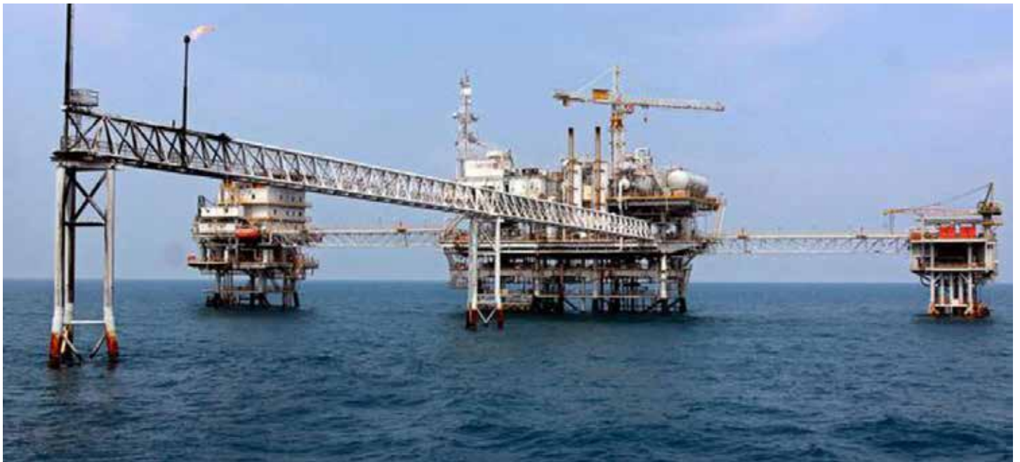
Ilustrasi ladang gas bumi di laut lepas.