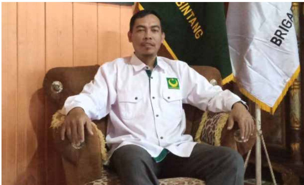
Sekretariat DPRD Kabupaten Paser