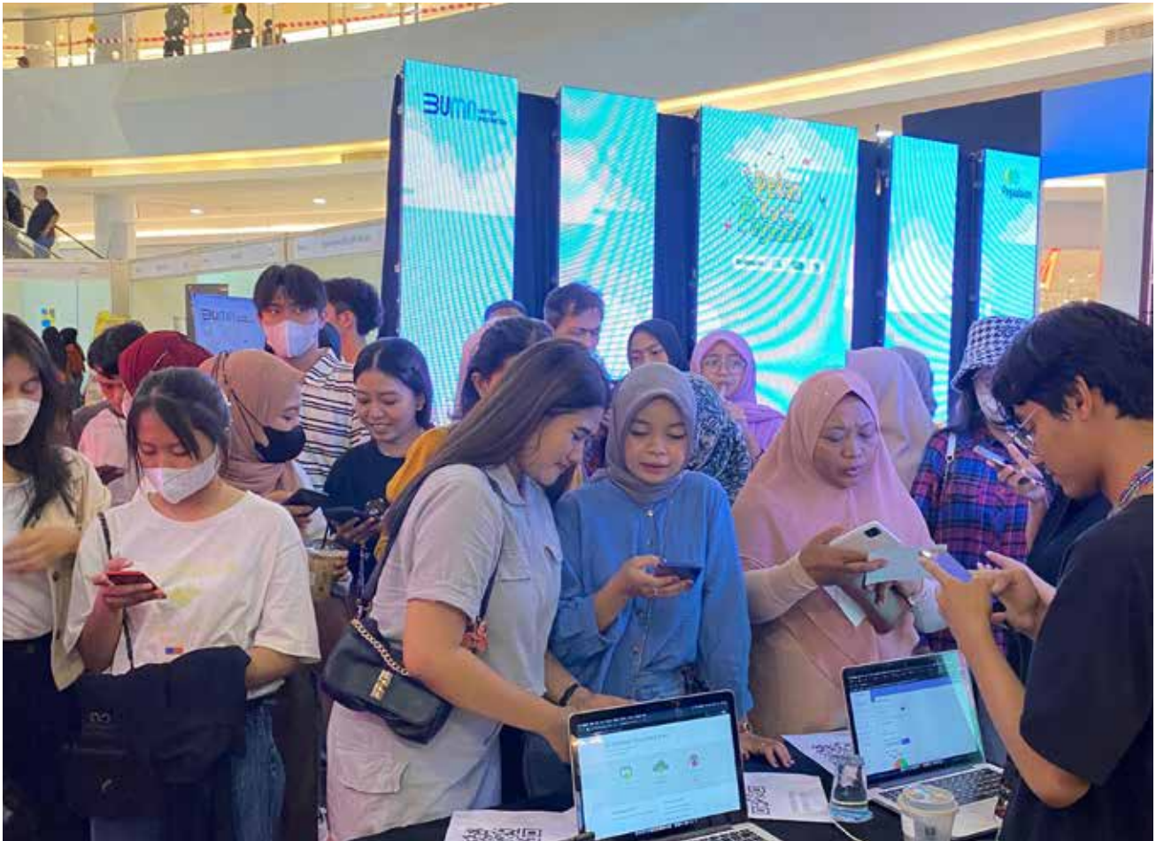
Pengunjung Pekan Raya Pegadaian di Bigmall Samarinda