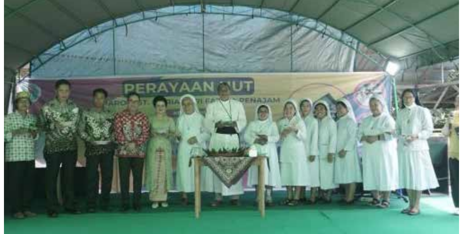
Perayaan HUT ke-23 Paroki Santa Maria dari Fatima di Penajam.