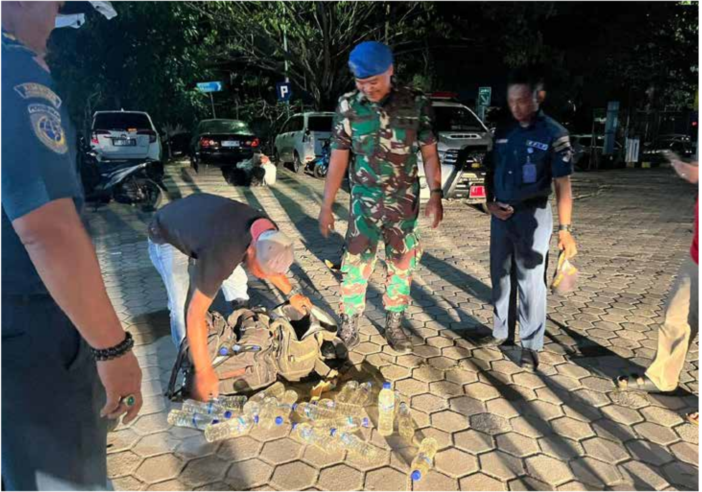
Pengamanan Tas Berisi miras di Pelabuhan Loktuan.