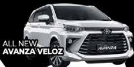
ALL NEW AVANZA VELOZ