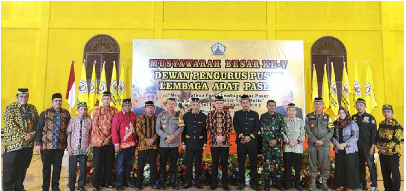
Ketua DPP LAP bersama Bupati Paser dan jajaran saat penutupan Mubes ke V