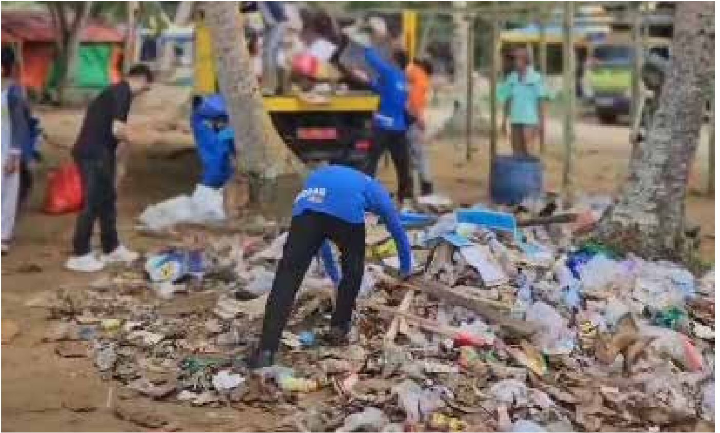
Kegiatan bersih pantai pasca libur lebaran bersama dengan pelajar PPU di Pantai Tanjung Jumalai, Selasa (16/4/2024). (Ist)