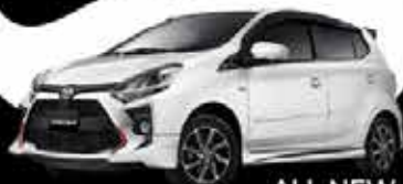
ALL NEW AGYA