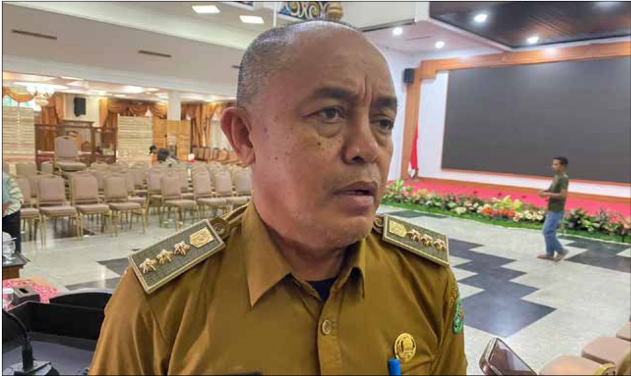
Camat Samboja, Damsik.