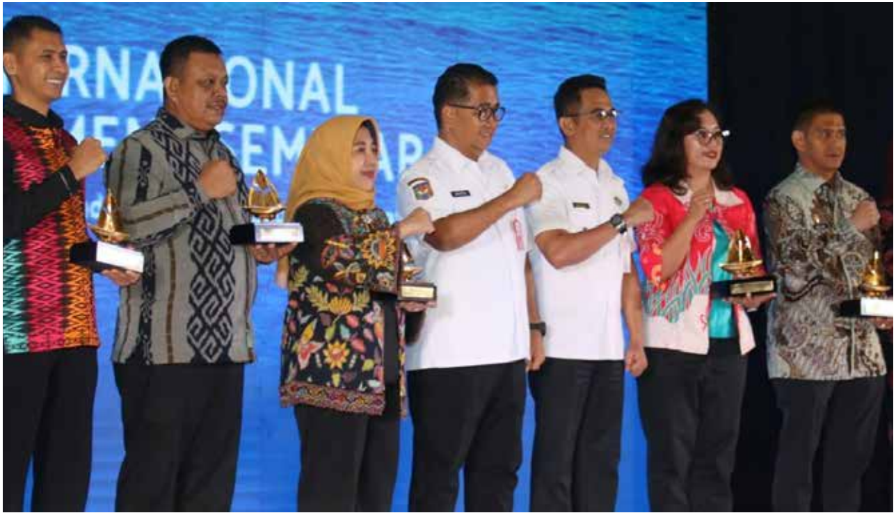
Wali Kota Balikpapan, Rahmad Mas'ud bersama Pj Gubernur Kaltim, Akmal Malik usai membuka ALKI II Zone Investment Forum 2023, di Hotel Jatra Balikpapan.