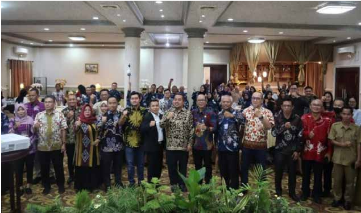
Jajaran Sekretariat DPRD se Kaltim