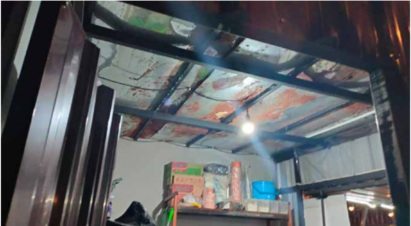
Booth kontainer di Kawasan Wisata Kuliner Sungai Tuak butuh perbaikan.