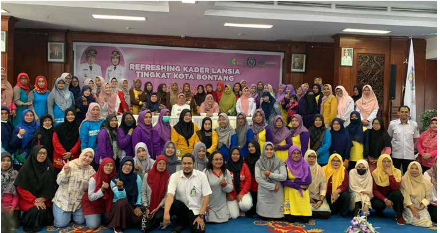
Kegiatan refreshing kader lansia tingkat Kota Bontang, di Auditorium 3 dimensi. (dwi)