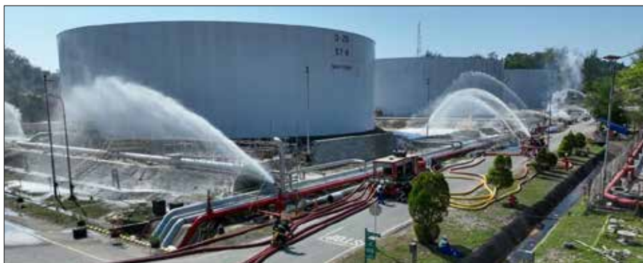
Major Emergency Drill Level 2 (Simulasi Keadaan Darurat Skala Besar) yang dilakukan PT Kilang Pertamina Internasional (KPI) Unit Balikpapan pada Rabu (25/10).

Warga yang terlibat dalam skenario tahun ini merupakan warga Kelurahan Karang Jati, Balikpapan Tengah. Proses evakuasi warga dilakukan bekerjasama dengan Badan Penanggulangan Bencana Daerah (BPBD). Warga dibawa menuju ke muster point yang be-