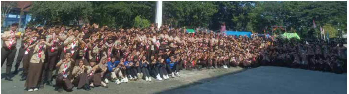
Foto bersama seluruh peserta, pembina, dan tamu undangan