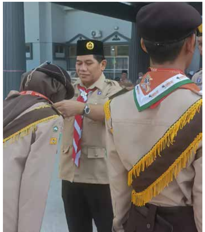
Penyematan tanda peserta oleh Wakil Rektor Bidang Akademik Universitas Mulawarman