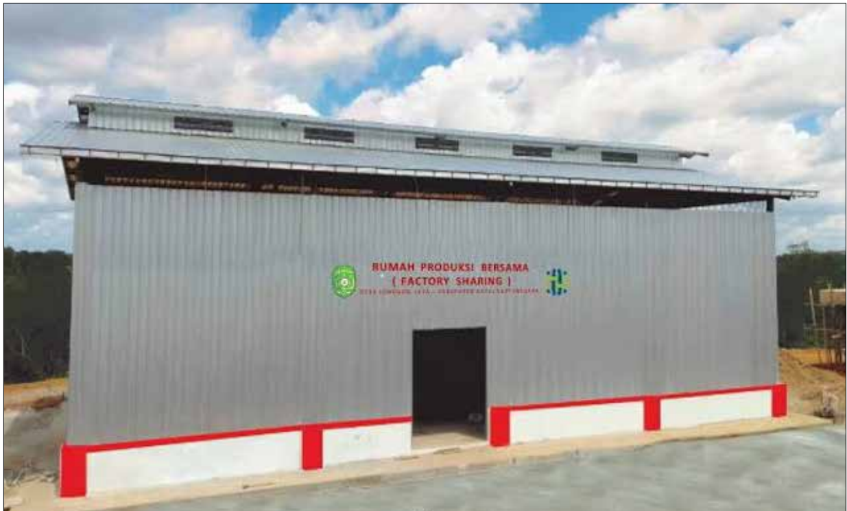
Gambaran RPB jahe yang dibangun di Desa Jonggon Jaya.