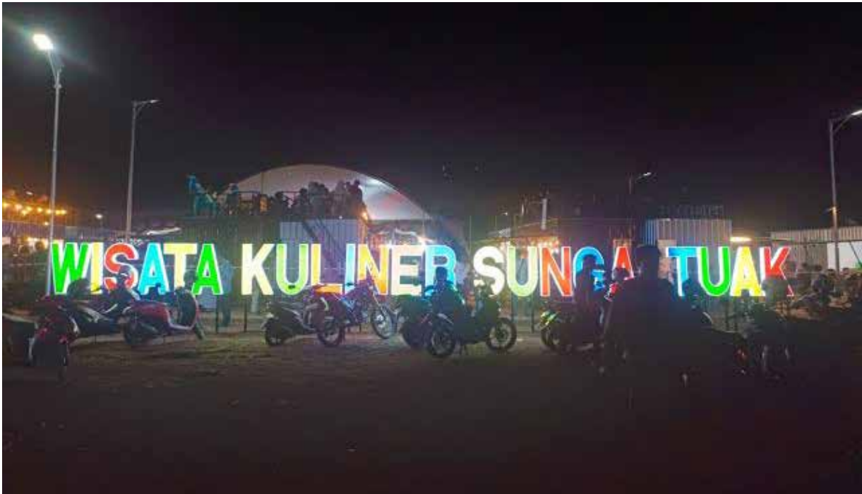
Wiskul Sungai Tuak