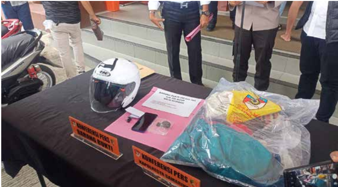
barang bukti milik korban diamankan polisi.