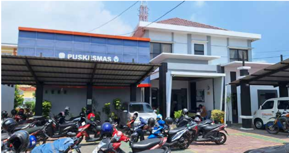
Puskesmas Bontang Utara II. (Yusva Alam)