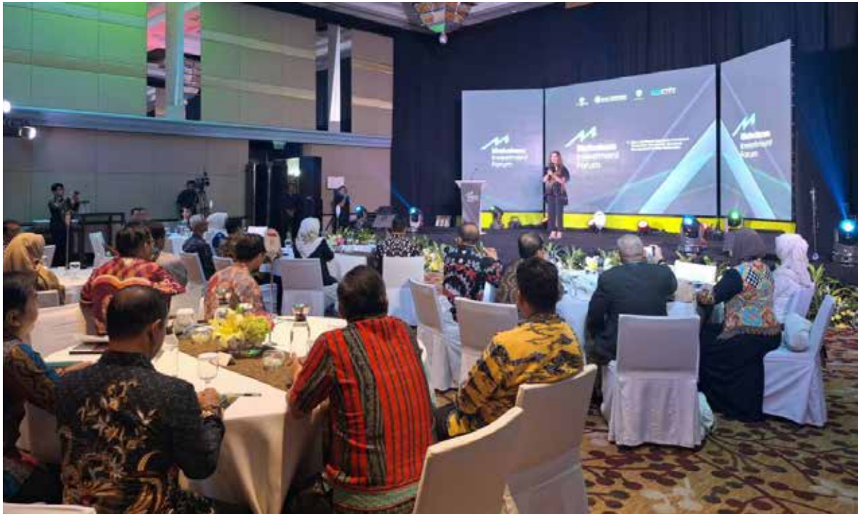
Mahakam Investment Forum (MIF) yang digelar DPMPSTP dan KPw BI Kaltim beberapa waktu lalu