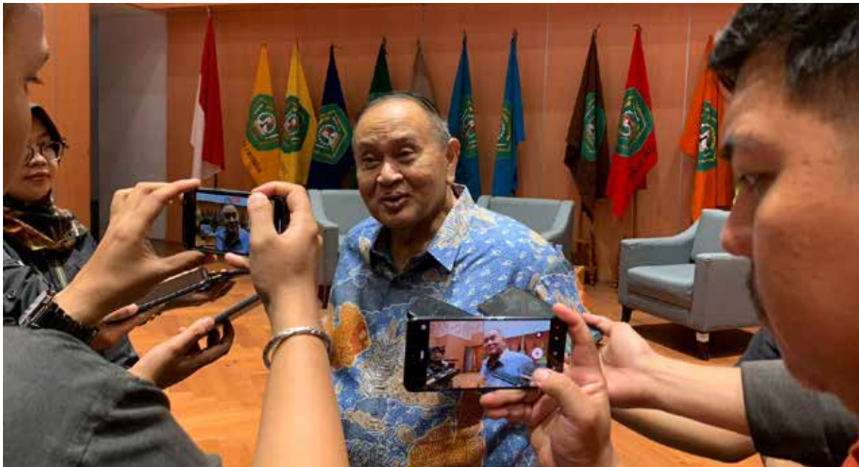
Foto: Emir Moies, salah satu Politisi Senior Kaltim, usai menghadiri Kuliah Umum di Unmul