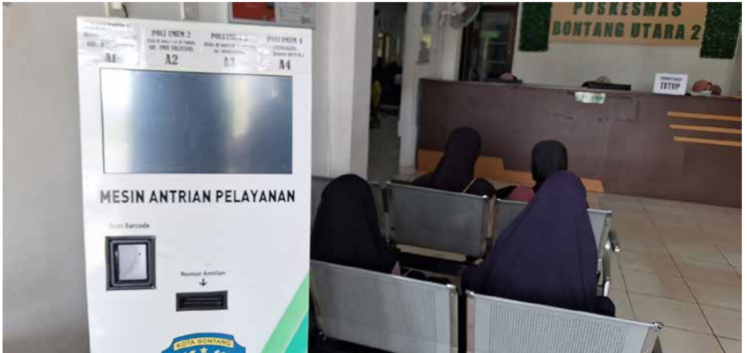
Mesin nomor antrian manual di Puskesmas Bontang Utara II. (Yusva Alam)