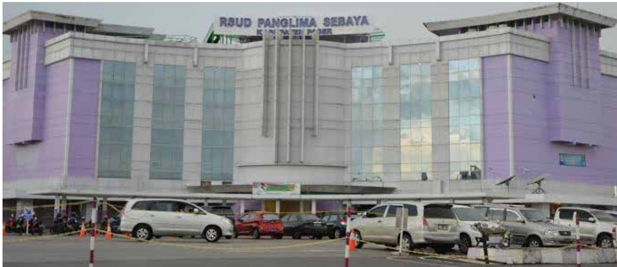
RSUD Panglima Sebaya