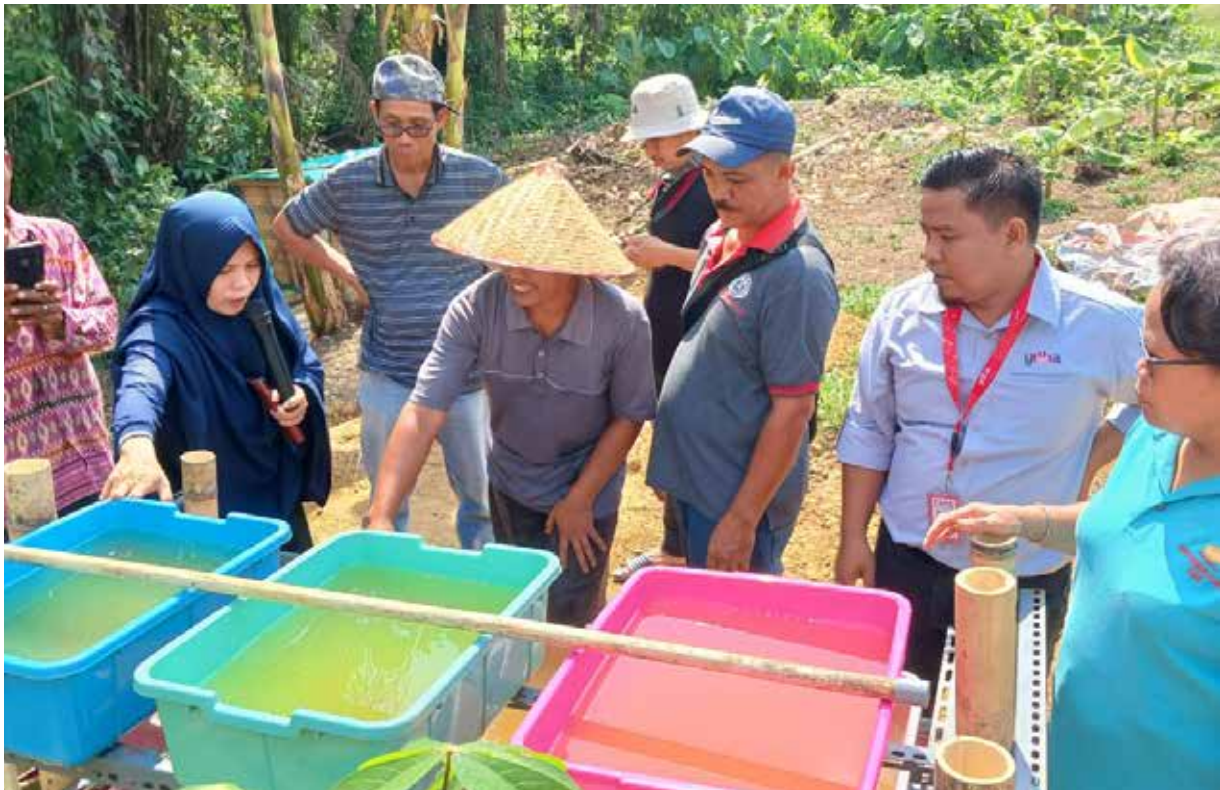
Proses budidaya cacing sutra