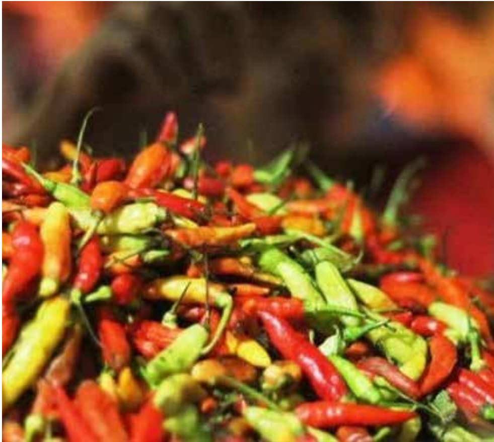
Ilustrasi cabai. (ist)