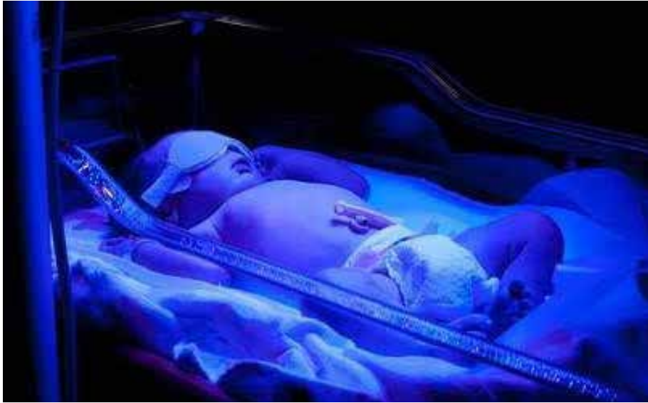
Ilustrasi fototerapi bayi.