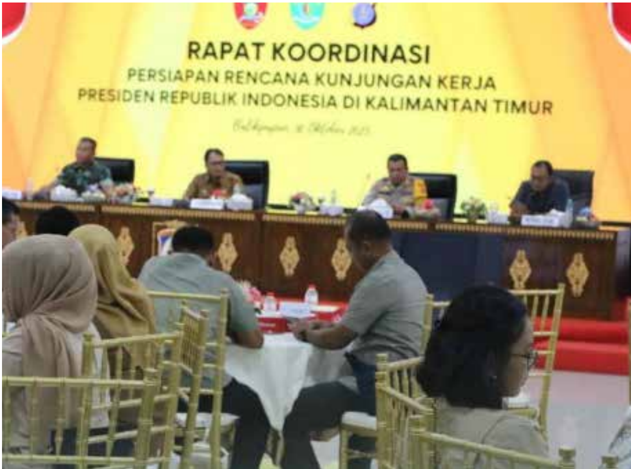
Rakor persiapan kunjungan tersebut digelar di Ruang Auditorium Balai Kota Balikpapan Lantai 3 Kantor Walikota Balikpapan, Senin (30/10/2023).