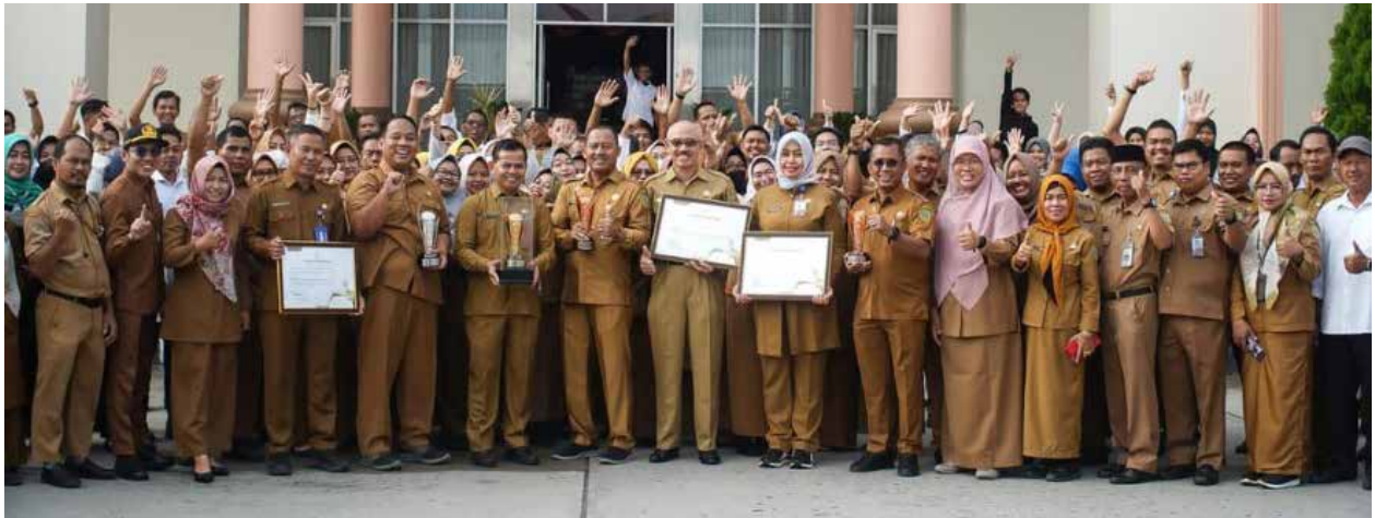
Foto bersama usai peraian 7 penghargaan Multy Award oleh Unmul.