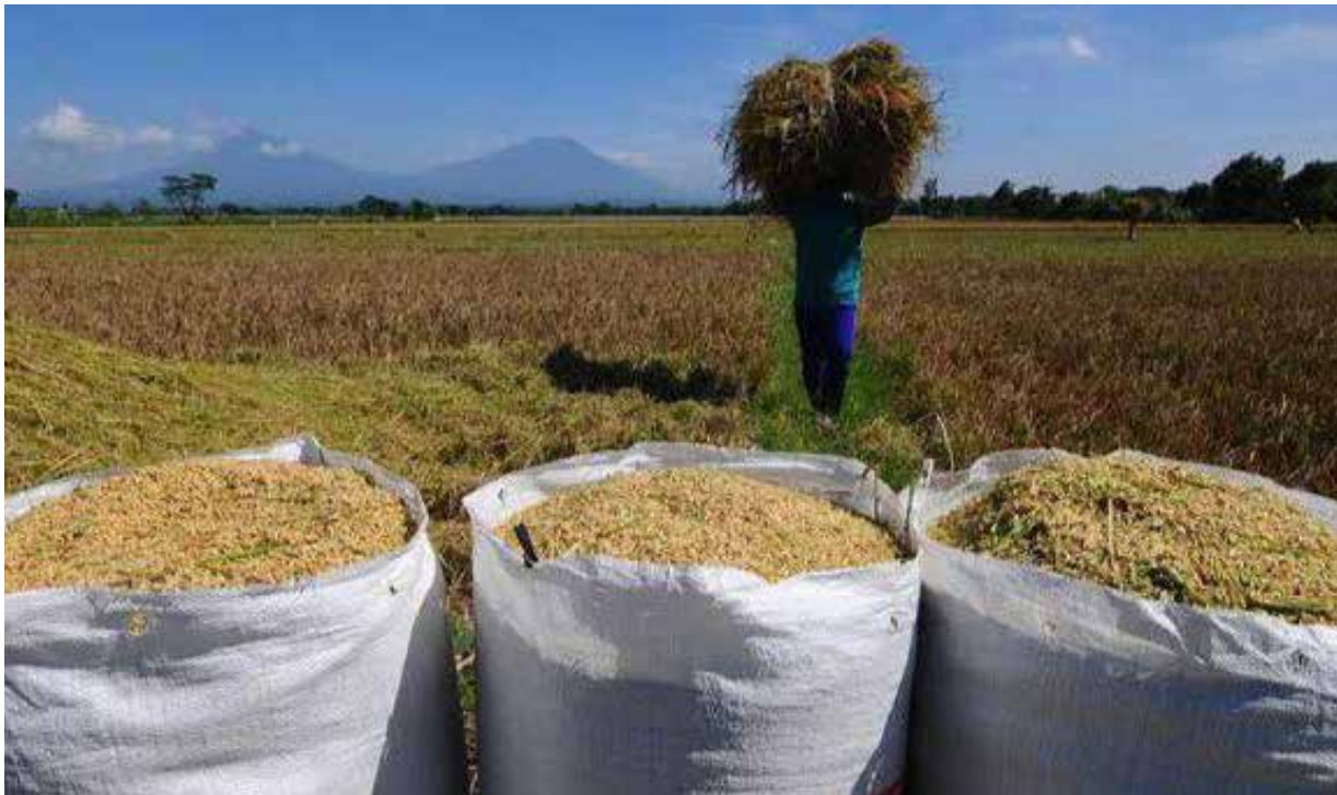
Ilustrasi Gabah Hasil Panen Petani