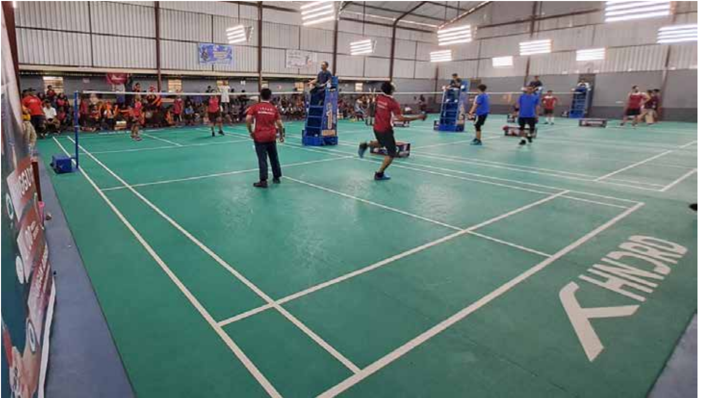
Peserta Badminton Turnamen 2023 dalam rangkaian HUT ke-21 RSUD Bontang. (Yahya Yabo)