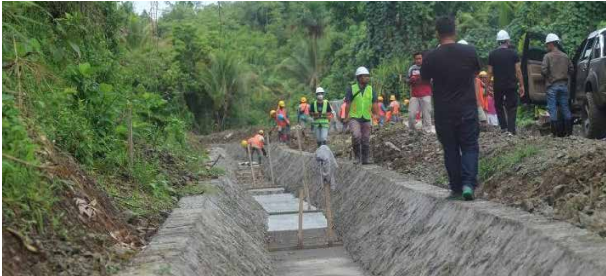
Ilustrasi. Suasana pembangunan jaringan irigasi pertanian.