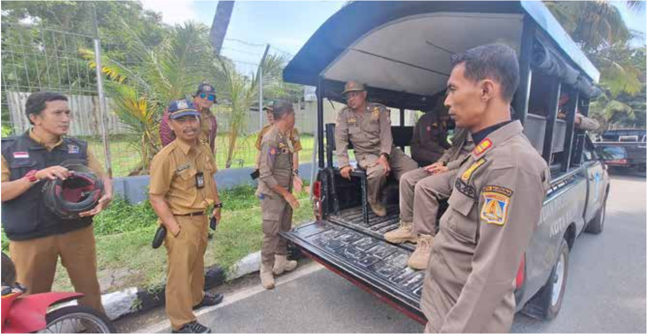
Tim Kecamatan Balikpapan Kota saat monitoring baliho dan algaka yang melanggar aturan.