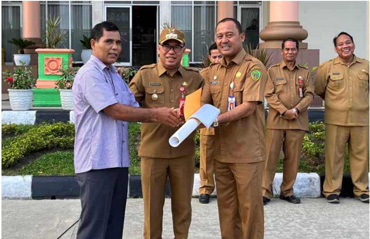
Pj Bupati PPU saat memberikan penghargaan pada salah satu ASN yang telah purnabakti pada apel rutin, Senin (6/11/2023).