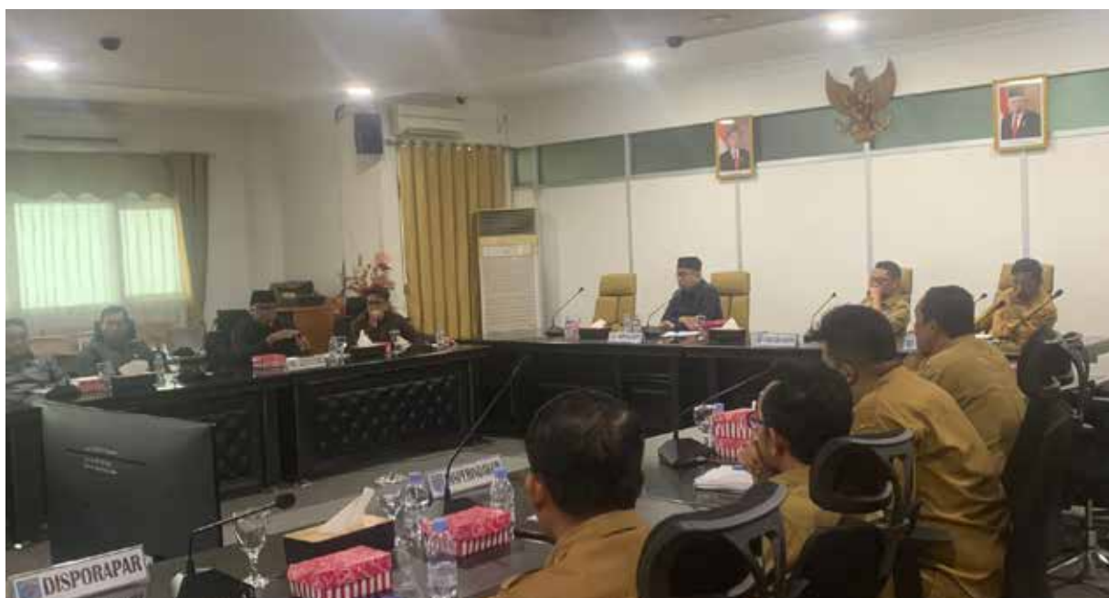
RDP di Sekretariat DPRD Kabupaten Paser