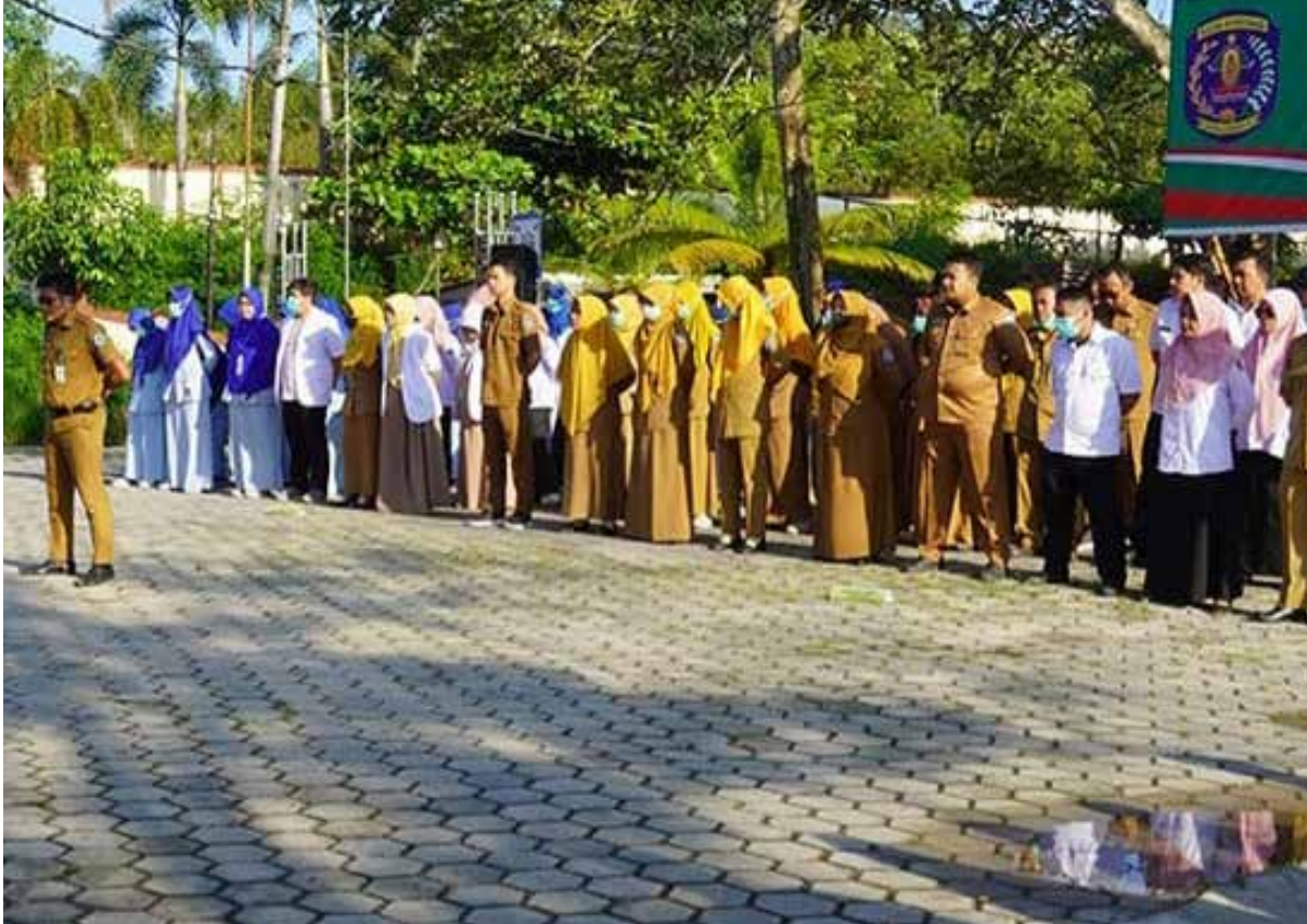
Apel persiapan HUT ke-21 RSUD Taman Husada.