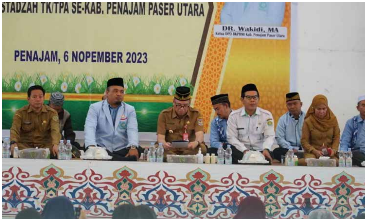
Pj Bupati PPU Makmur Marbun saat pembukaan sosialisasi dan bimbingan teknis kurikulum Taman Kanak-Kanak (TK) dan Taman Pendidikan Al-Qur'an (TPA) 2020, Senin, (6/11/2023).