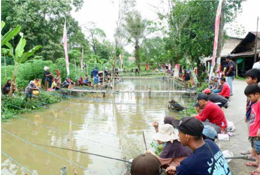
Kegiatan Lomba Mancing Kelurahan Satimpo.