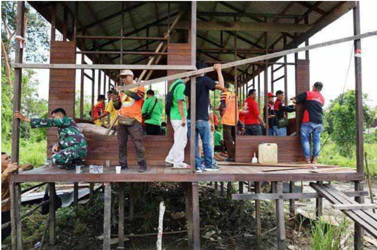
Ilustrasi pelaksanaan program RTLH.