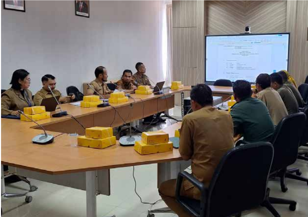
Rapat persiapan upacara HKN ke-59 di Ruang Rapat Asisten II. (Yusva Alam)